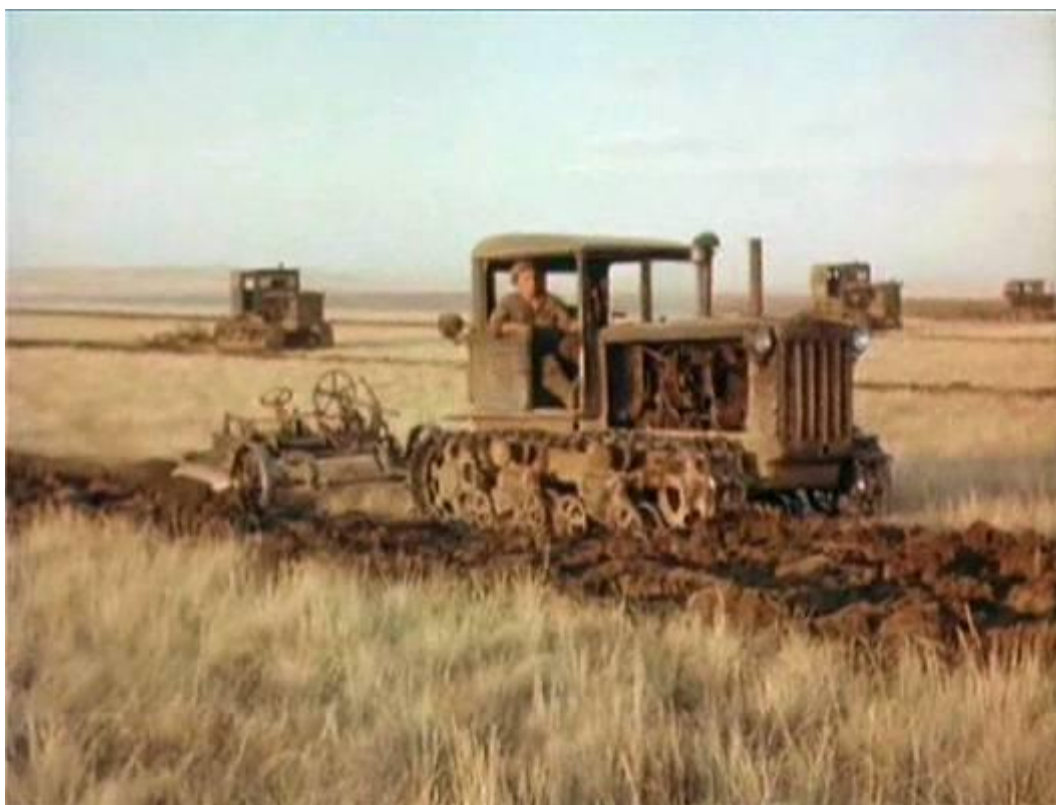
Рисунок 5 – Кадр из фильма «Иван Бровкин на целине» (1958 г.), снимавшийся в совхозе Комсомольский Адамовского района

Современная промышленная продукция, ассоциирующаяся с регионом помимо металлургии, это главным образом оренбургский газ и башкирская нефть (башкирский бензин). Важной исторической вехой степного региона России является освоение целины (рис. 5).