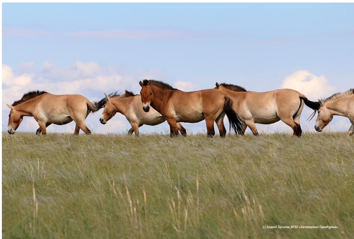
Рисунок 6 – Лошади Пржевальского в Оренбургском заповеднике

Для большей части Восточного Оренбуржья – это судьбоносное событие, повлиявшее на жизнь тысяч людей. Оренбургский каравай – один из символов области, ставший таковым именно в эту эпоху. Исключительно степные природные достопримечательности региона – это ковыльные степи, тюльпаны, весной покрывающие степь до самого горизонта, суслики и сурки, дрофа и стрепет, стада свободно пасущихся лошадей Пржевальского (рис. 6), которые содержатся в полувольных условиях на территории Оренбургского заповедника. Оренбургский заповедник, наряду с немногочисленными целинными участками степей, сохранившимися на бывших и существующих военных полигонах, также степной символ региона [16-18]. В регионе находится единственный в мире Институт степи – научно-исследовательский институт, занимающийся изучением всех аспектов степи (растительного и животного мира, почв, ландшафтов, истории и экономики степей мира) [19, 20].