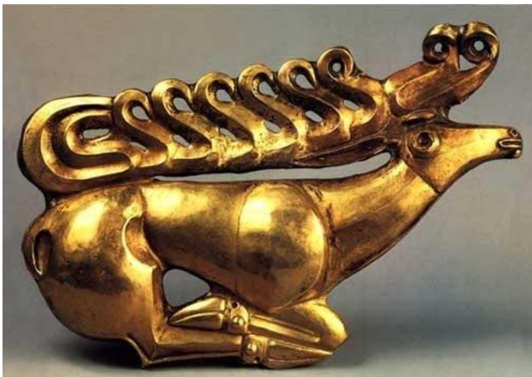
Рисунок 4 – Золотой сарматский олень