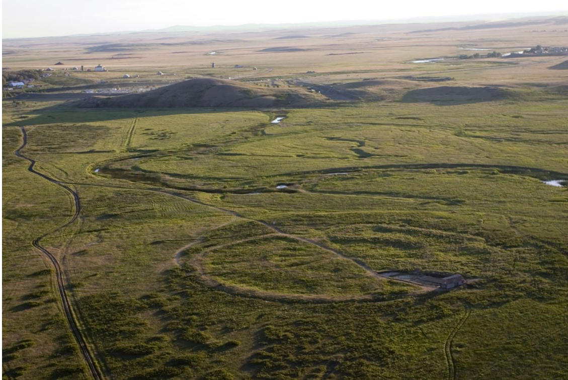
Рисунок 3 – Панорама окрестностей Укрепленного поселения Аркаим

Ильменский заповедник расположен в Челябинской области близ города Миасс и является одним из первых созданных в России заповедников.