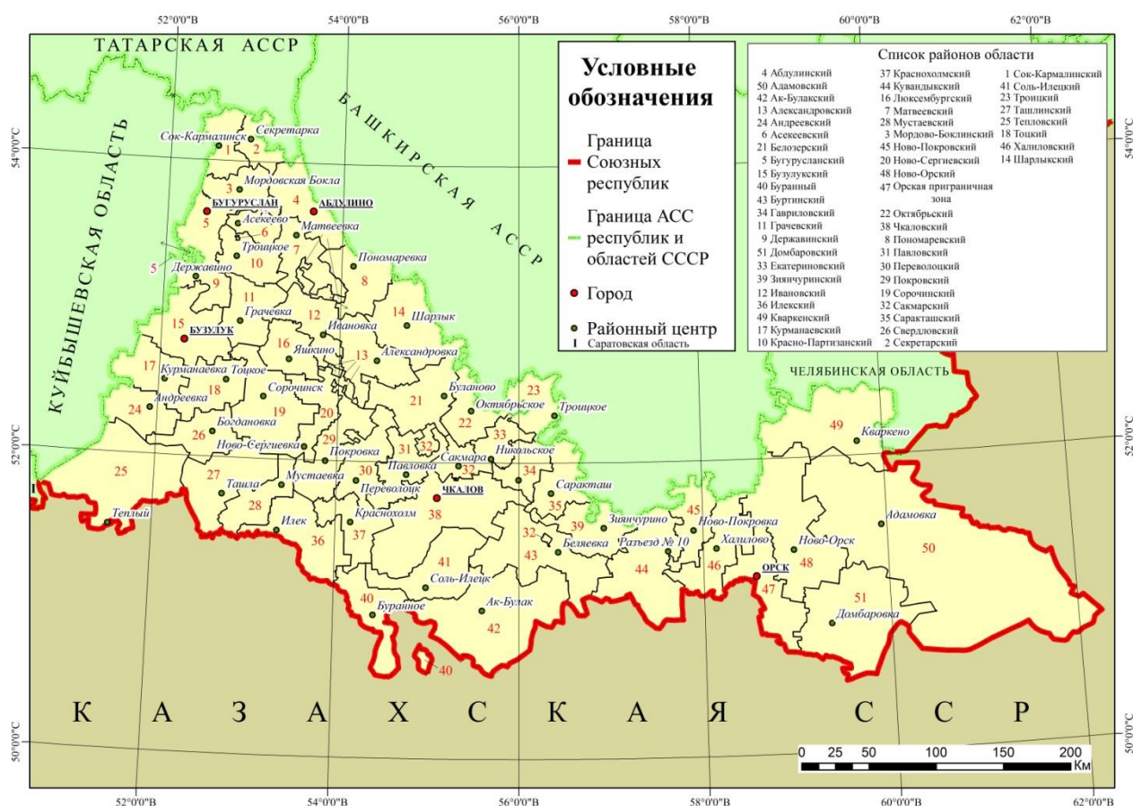
Рисунок 2 – Административно-территориальное устройство Чкаловской области в 1939 году

На 1 января 1939 года Чкаловская область была поделена на 50 административных районов и 5 городов (рис. 2).