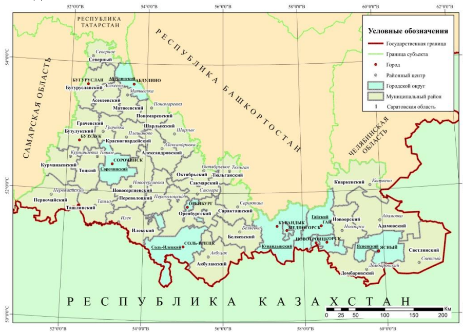
Рисунок 3 – Административное устройство Оренбургской области в 2022 году Примечание: составлено автором на основе [13]

Возможности программы ArcGIS for Desktop, помимо визуализации данных, позволяют получить более глубокие и расширенные выводы при использовании инструментов пространственной статистики. Их применение является задачей наших дальнейших исследований.